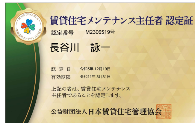
オモテ面（顔写真なし）